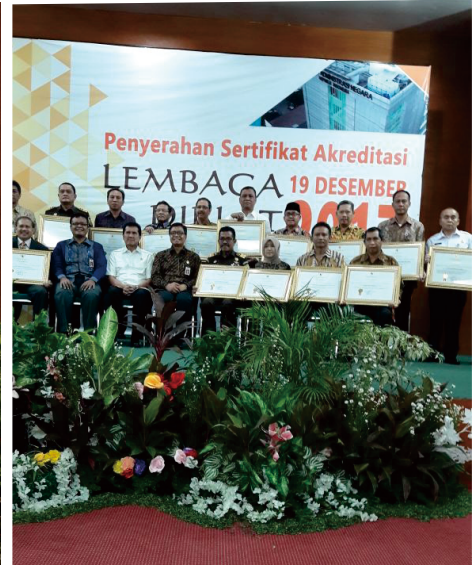
Penerimaan Sertifikat Akreditasi A untuk Pelatihan Dasar Calon PNS Golongan II dari Lembaga Administrasi Negara