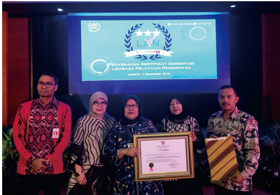
Penerimaan Sertifikat Akreditasi A Lembaga Penyelenggara Pelatihan Dasar Calon PNS Golongan III dari Lembaga Administrasi Negara. Pelatihan kepemimpinan Tingkat III, Pelatihan kepemimpinan Tingkat IV, dari Lembaga Administrasi Negara.